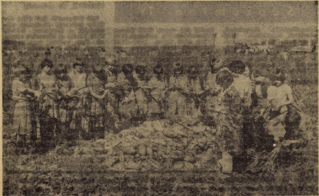
În imagine, elevi din clasele VI și VII de la Școala generală din Laslea la recoltat și decolectat specia furojeră