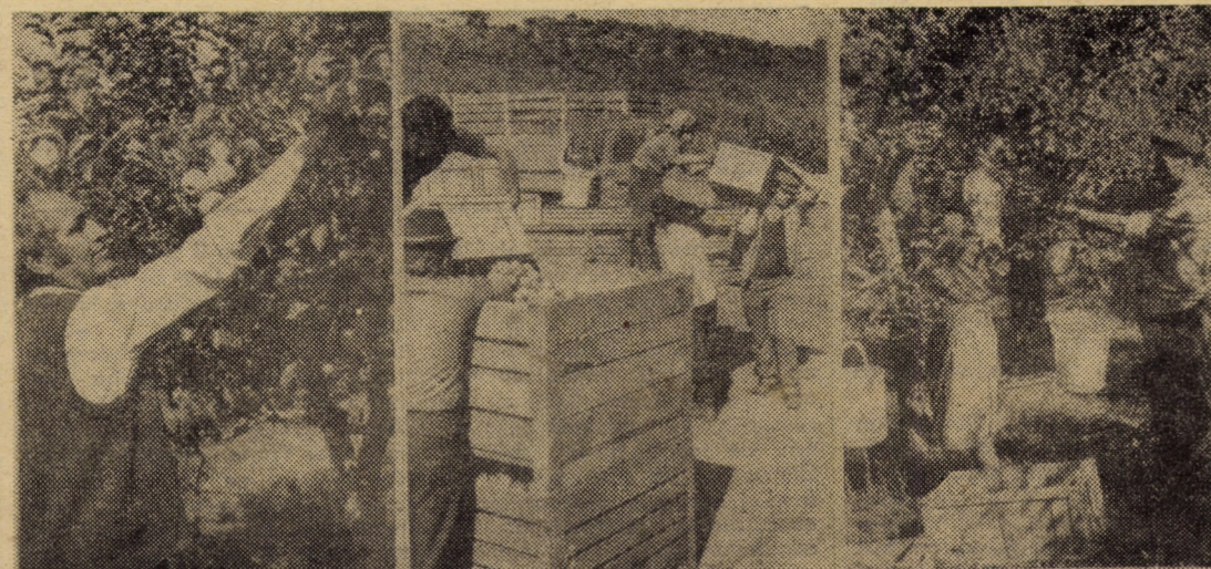
Activitate febrilă în livada fermei nr. 3. „Meriele culese sînt imediat sortate și livrate beneficiarului”, spunea ing. V. Constantin, iar imaginile surprinse sînt concludente