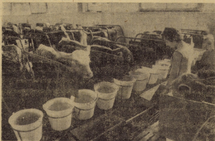
Unul din grajdurile bine întreținute cu tineret bovin la A.E.I. Orlat.

În urmă cu câțiva ani, aportul Fermei nr. 3 Brădeni la realizările întreprinderii piscicole Zau de Cimpie era destul de modest, cantitatea de pește recoltată nu depășea 70 tone. „Astăzi - precizează șefa fermei, ingineră Maria Axente - se poate vorbi despre o evoluție pozitivă a activității noastre, în sensul că producția anuală de pește aproape s-a dublat“. Argumentul? Până la această oră a fost recoltat peștele din două heleștee, producția obținută depășind 99 tone. Greutatea medie pe exemplar în jur de un kilogram. Se poate vorbi în acest context despre preocuparea unor lucrători ca Mihai Stafent, Nicolae Șavu, Ioan Barbu ș.a. pentru asigurarea unei furajări corespunzătoare a peștilor de-a lungul întregului ciclu de creștere, în vederea înregistrării unui spor de greutate constant. Se poate vorbi despre extinderea și modernizarea acestei ferme piscicole care însumează actualmente un luciu de apă de 162 hectare, compartimentat în 3 heleștee, 5 bazine de iernare a reproducătorilor și 3 bazine de reproducere.