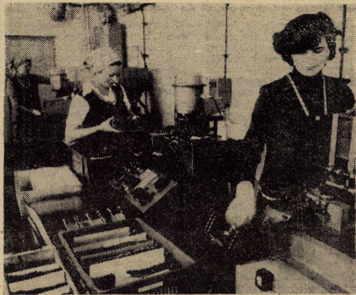
Imaginea de față redă un aspect din atelierul de umplut mine cu pastă de la „FLARO” Sibiu, unde zilnic se realizează o cantitate de cca. 250 000 bucăți mine de diferite culori. În urma eforturilor depuse, harnicul colectiv de muncitori al acestui compartiment lucrează în prezent în contul lunii decembrie a.c.

În cursul după-amiezii, președintele Karl Carstens, doamna Veronica Carstens, celelalte oficialități române și vest-germane, care l-au însoțit pe înaltul oaspete în călătoria sa, s-au înapoiat în Capitală.