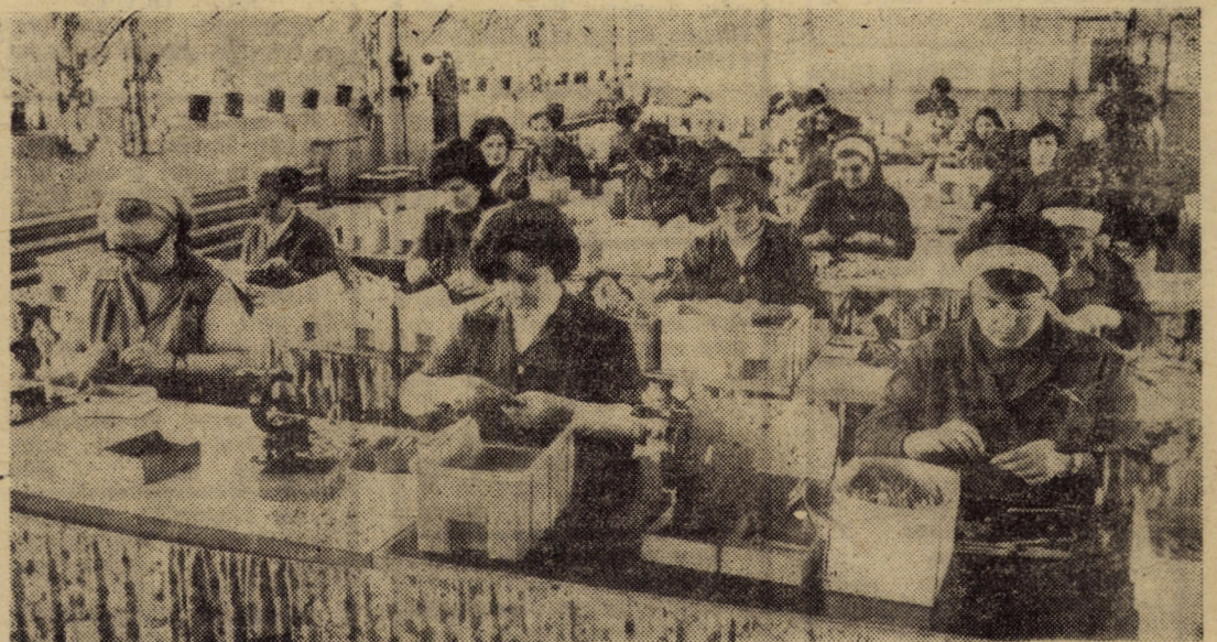
Compartimentul de asamblare a articolelor de scris de la „FLARO” Sibiu. În urma eforturilor depuse, acest colectiv a reușit să onoreze toate contractele încheiate cu beneficiarii.