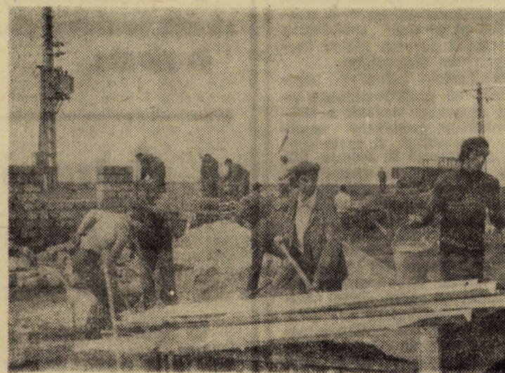
La realizarea construcțiilor participă tot personalul stațiunii

10 iunie, 1979. Șoseaua Sibiu — Agnita, kilometrul 9. În dreapta se află terenul cunoscut sub denumirea de „Dealul Dăii”. Terenul are forma unei albie uriașe. Pe margini, deoparte și de alta, covorul vegetal e împănănat cu smircuri din care se itesc pipirig și trestie. Cu cît cobori terenul devine tot mai apăsător și spre vale se transformă în mlaștină. Ei bine, la data sus-amintită, acest teren a fost incredintat spre folosință Stațiunii de cercetări zootehnice Cristian, atunci înființată.