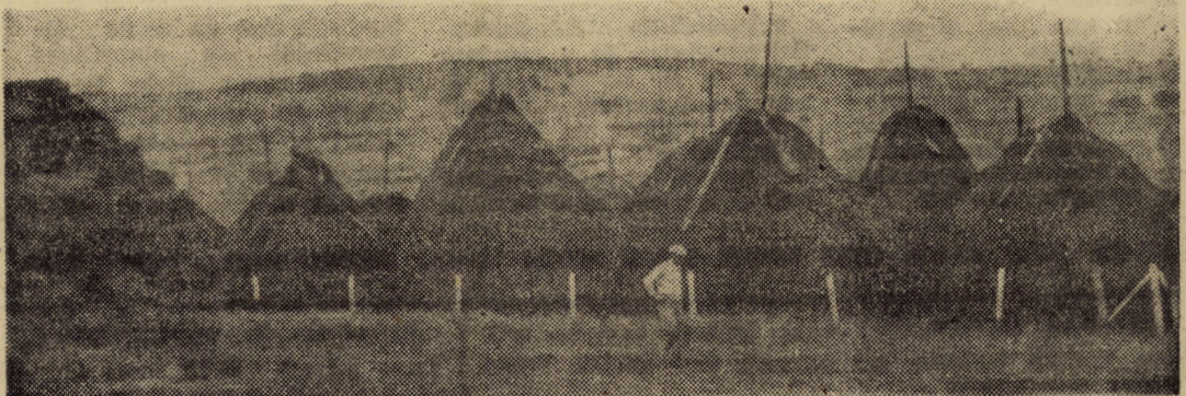
Șirele de fibroase și stogurile de fin baza producțiilor mari.