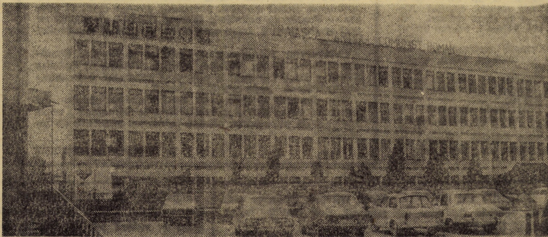
Una dintre sutele de imagini sugestive ale muncii pașnice pe meleaguri sibiene

vederilor Decretului 620/1973, republicat în 1977, în care se precizează obligativitatea contorizării energiei termice. Contorizarea ar permite înregistrarea exactă a consumului efectiv făcut pe fiecare apartament (eventual scară). Greutatea — după cum ne preciza ing. S. Dicu — constă în lipsa contoarelor. Oare specialiștii de la Fabrica de elemente hidropneumatice din Sibiu n-ar putea să rezolve o asemenea problemă? În mod sigur, atunci fiecare dintre noi am consuma apă sau agent termic doar în măsura în care am avea efectiv nevoie, iar consumurile energetice ar scădea substanțial.