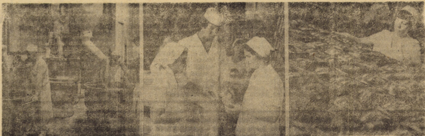
Întreprinderea de morărit și panificație Sibiu: locul de unde piinea pomește către oameni

vor prezenta astăzi, 12 noiembrie, ora 17, un spectacol muzical-literar în sala clubului întreprinderii „Firul roșu”. • Tot astăzi, la Casa pionierilor și soimilor patriei din Dumbrăveni, membrii clubului de dezbateri politice participă la masa rotundă cu tema: „Prietenia și colaborarea cu toate țările socialiste — orientare fermă a politicii externe a României”. • Vineri, 13 noiembrie, clubul de dezbateri politice al Școlii generale din Nocrich organizează dezbaterile cu tema: „Criza economică mondială — determinări și implicații”. • Sîmbătă, 14 noiembrie, în cadrul acțiunii „Prietenul copiilor — prietenul lumii”, pionierii din detașamentele claselor a III-a de la Școala generală din Dumbrăveni vor cunoaște și aprofunda aspecte legate de politica de pace a secretarului general al partidului nostru, tovarășul Nicolae Ceaușescu.