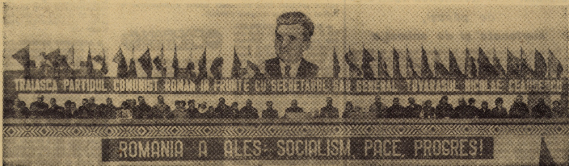
Aspect de la tribuna din Piața Unirii — Sibiu