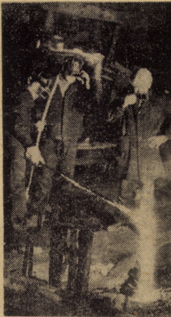
Elaborarea unei noi șarje de oțel la turnătoria întreprinderii „Independența” Sibiu