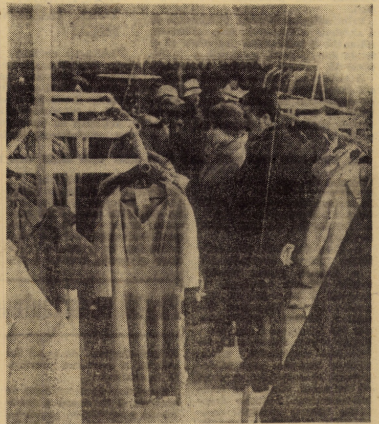
Magazinul specializat în confecții pentru bărbați și femei din cadrul Complexului de deservire a populației al U.J.C.M. Sibiu din Piața Unirii, se înscrie în circuitul comercial al municipiului cu produse în bună parte originale, rod al creatorilor din cadrul cooperativei meșteșugărești

Acum, în pragul celui de-al doilea an al cîmănalului, ideile-forță ale expunerii tovarășului Nicolae Ceaușescu însuflețesc conștiințele milioanei de oameni ai muncii din patria noastră și jalonează în mod strălucit drumul victorios către perspective deschise întregii națiuni de Congresul al XII-lea al partidului.