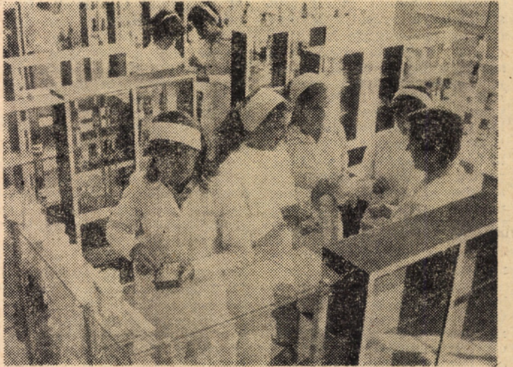
Înainte de efectuarea practicii în farmacii, elevii Liceului sanitar din Sibiu se familiarizează cu noțiunile elementare de preparare a rețetelor în laborator