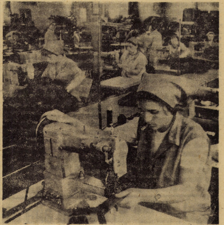
La una din benzile de lucru din atelierul confecționat valize al întreprinderii „13 Decembrie”, Sibiu — atelier declarat frunțos pentru bunele rezultate obținute în realizarea sarcinilor de export