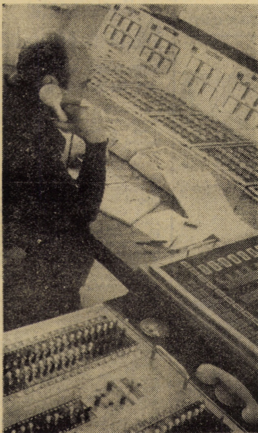
Coordonatorul de manevre din cadrul compartimentului de distribuție al întreprinderii de rețele electrice Sibiu