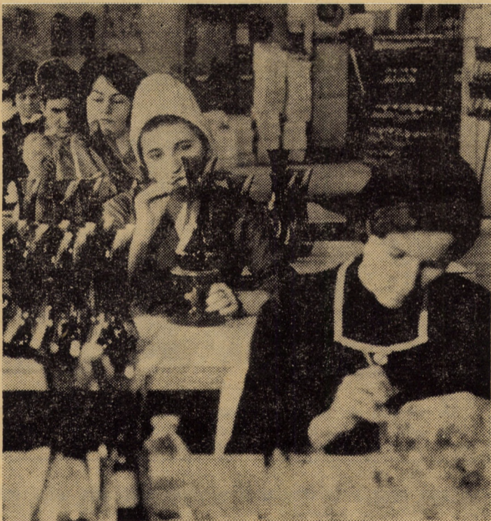
La valoarea intrinsecă a sticlăriei produse la Avrig, un plus îl adaugă și talentatele desenatoare de la secția de pictură.

Toate aceste produse sint realizate la un înalt nivel tehnic și calitativ, fiind comparabile cu cele mai bune produse similare de pe plan mondial.