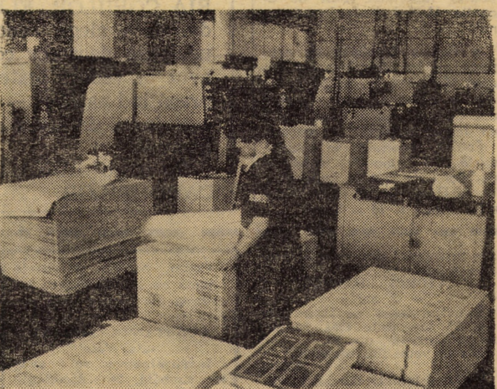
Vedere parțială a secției ofset a întreprinderii poligrafice Sibiu