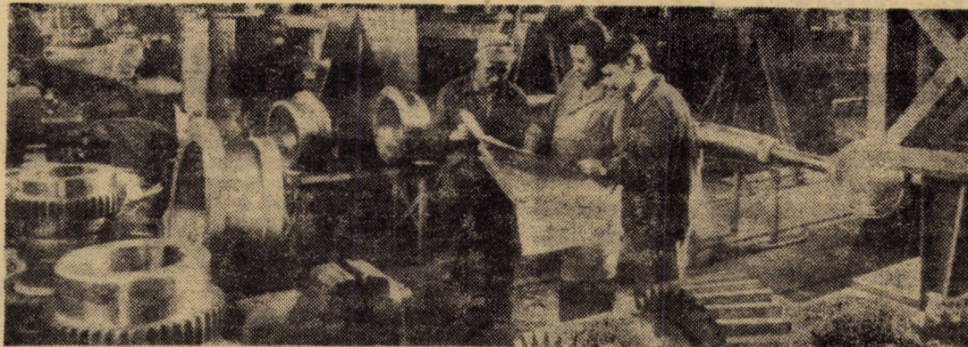
De mai bine de doi ani, la întreprinderea „Independența” Sibiu, secția utilaj metalurgic, se realizează o serie de produse „gigant” destinate exportului — utilaje pentru care harnicul colectiv de muncă a primit unanime aprecieri din partea beneficiarilor.