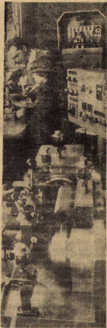
Imagine de la punctul de control al virfurilor pentru minele cu pastă (întreprinderea „Flamura roșie” Sibiu).

DECRET al Consiliului de Stat al Republicii Socialiste România privind efectuarea recensămîntului animalelor domestice (pag. 3 și 4)