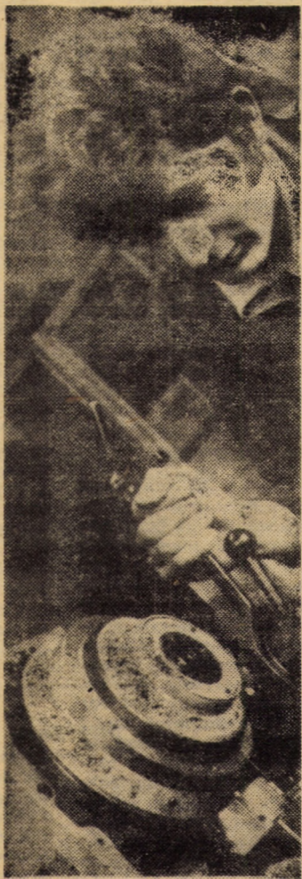
Reglarea și verificarea fiabilității instalației hidraulice pentru mașini de rectificat universale la fabrica de elemente hidropneumatice a întreprinderii „Balanta” din Sibiu

COMITETUL POLITIC EXECUTIV AL COMITETULUI CENTRAL AL PARTIDULUI COMUNIST ROMÂN