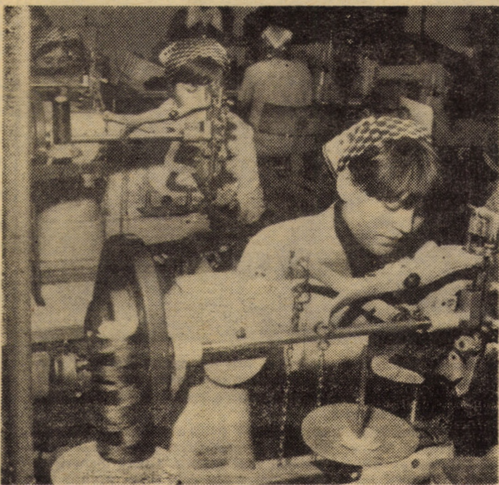
Imagine de la una din benzile de lucru cu mașini speciale de cusut de la F.I.P. Agnita, unde media de vîrstă a muncitoarelor se situează cu puțin peste 20 ani. Măiestria profesională se află însă la cel mai înalt nivel!

ORGAN AL COMITETULUI JUDEȚEAN SIBIU AL P.C.R. ȘI AL CONSILIULUI POPULAR JUDEȚEAN