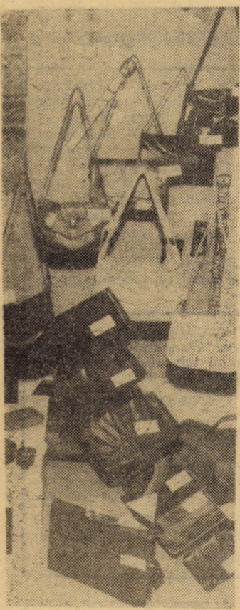
Din bogata gamă de produse de marochinărie realizate în prezența unităților Cooperativă meșteșugărești ale județului Sibiu.

Oare cum se vor întîlni peste ani, ele, „mamele“, cu fiii și fiicele lor, pentru că unii sînt deja mari și înțeleg ce s-a petrecut și pentru ce s-au pentru cine au fost abandonati. Poate că unii dintre ei vor ști să le spună: „Aceasta înseamnă a trăi, să nu trăiești numai pentru tine“.