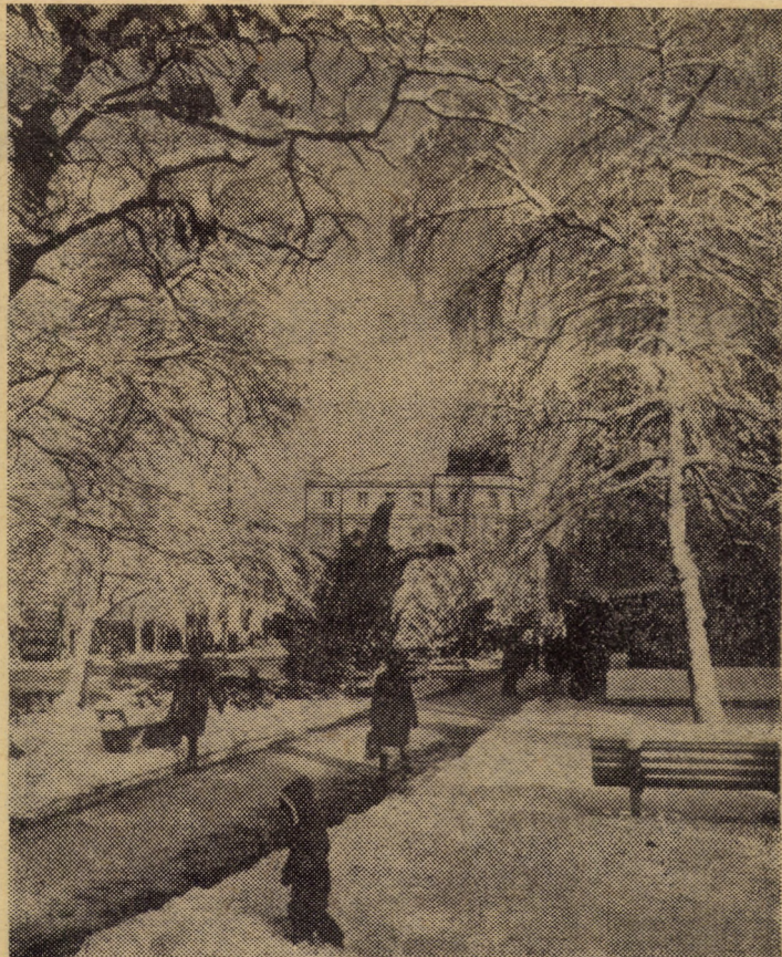
Iarna ne-a dat din nou de veste că se află în drepturi depline