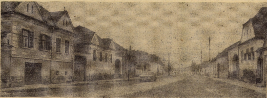
Comuna Valea Viilor — una din frumoasele localități de pe raza județului Sibiu, unde mina gospodăriei se remarcă pas cu pas.