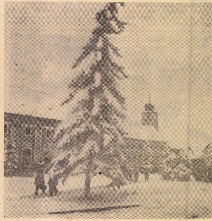
Sub povara zăpezii

După un Revelion uscat, fără un fulg de zăpadă și după alte câteva zile neobișnuit de calde pentru luna ianuarie, iarna s-a răzvrătit, instăpînîndu-se, într-o singură noapte, albă, pufoasă, odihnită. Copiii au dat chiot de bucurie și s-au bulucit, înarmați cu săni, pe derdeluș. Prevăzători, mulți conducători auto au renunțat la planificatele „ieșiri”. Alții au continuat să circule sfidînd condițiile meteo-rutiere neprielnice, nu puțin apelînd la „întăritoare” pentru combaterea... gerului! La același remediu au apelat și destui pietoni, consecințele fiind - ca de atîtea alte rînduri - grave. Dar să „developăm” din cronica străzii evenimente de dată recentă.