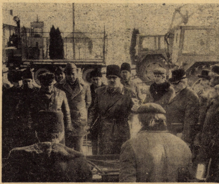
În aceste zile, la Casa agronomului din Tirnava se desfășoară instruirea specialiștilor din unitățile agricole, a mecanizatorilor, privind utilizarea agregatelor complexe la lucrările agricole din cîmp

Emil Tătar (Brașov): Cazul medicului Nicolae Pîrlățeanu din Bazna a fost discutat în ședința din 28.X.1981. Potrivit normelor sanitare în vigoare, copii după actele medicale se eliberează numai cu aprobarea conducerii spitalului. (N.I.D.)