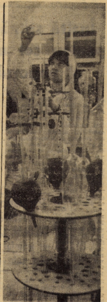
Viitorii operatori chimiști, elevii ai Liceului industrial de chimie „Carbosin” Copșa Mică, își însușesc, încă din școală, o bună pregătire profesională în cadrul laboratoarelor cu o bună dotare tehnică.

Am participat, deunăzi, la o ședință de C.O.M. la întreprinderea de mînuși și ciorapi Agnita. Exact la ora fixată (la cumpăna dintre schimburile I și II) ședința a început, prezent fiind și reprezentantul centralei tute-