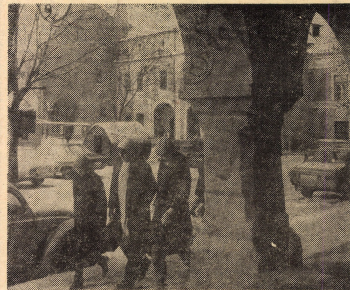
Din peisajul Sibiului vechi

16,00 Telex. 16,05 Profesiunile cincinalului. 16,25 Rezultatele tragerii pronoeexpres. 16,30 Actualitatea muzicală. 16,50 Agenda pionierilor. 17,00 Universul femeilor. 17,50 1001 de seri. 18,00 Închiderea programului. 20,00 Telex. 20,25 Actualitatea economică. 20,40 Telex.