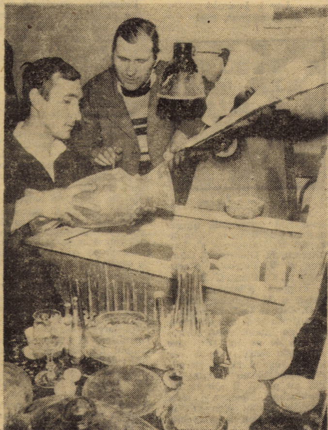
Cristalul românesc, cristal de „Vitrometan“, a adunat în strălucirea sa, de-a lungul unui deceniu, pasiunea și măiestria celor mai buni meșteri sticlari

Au trecut 10 ani de cînd, la „Vitrometan“ Medias, sticlari dintre cei mai experimentați luau pentru prima oară în teava de suflat pasta incandescentă de cristal. Au fost multe încercări pînă ca produsul să corespundă. De fapt, la început s-a turnat doar o placă cu inscripția „Primul cristal românesc — „Vitrometan“, 3 ianuarie 1972“. Cei de la „Vitrometan“ au fost, deci, primii din țară care au produs, pe scară industrială, cristalul. Începutul n-a fost ușor, însă în scurt timp s-au deschis perspective foarte favorabile pentru întreprindere și pentru economia națională. Astfel, cu un trimestru mai repede decît era prevăzut s-au atins și depășit toți parametrii finali ai investiției. Producția de cristal în cuptorul cu creuzete a început abia în trimestrul II 1972 și astfel producția anului a fost destul de mică. În 1973, s-a realizat o producție de 8 ori mai mare decît în 1972, în valoare de peste 10 milioane lei. Pînă în anul 1979, cu aceleași utilaje, producția a crescut încă de 4,3 ori, ceea ce vorbește de la sine despre eforturile și rezultatele obținute. Creșterea producției și, respectiv, a productivității muncii sînt legate mai ales de specializarea unor cadre la operațiile de topirea sticlei, fasonarea topiturii și, mai ales, de sculpta-