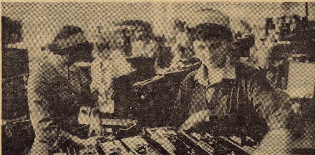
Faza finisaj și control final al genților diplomat la întreprinderea „13 Decembrie” Sibiu

Tineretul român mobilizat pe front, animat de un înflăcărat patriotism, înțelegînd momentele de grea cumpănă prin care trecea țara, a luptat cu eroism în rîndurile armatei pentru a lungarea inamicului din teritoriul cotopt și formarea statului național unitar român. De asemenea, prezența la Marele Sfat al națiunii române de la Alba Iulia din 1 decembrie 1918 a 16 reprezentanți ai tinerimii universitare, ca și a unui mare număr de tineri muncitori, țărani și intelectuali era o confirmare a contribuției tinerei generații, a tineretului socialist la lupta pentru împlinirea dezideratului de secole al poporului.