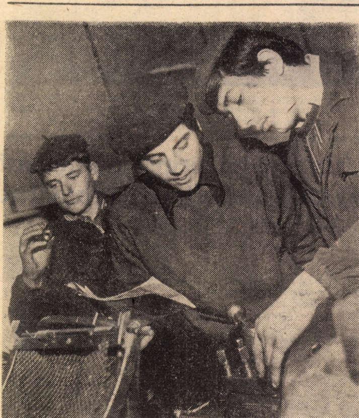
Printr-o bună organizare a muncii, în cadrul atelierului mecanic, elevii claselor X, XI și XII de la Liceul agroindustrial Sibiu au reușit ca în acest an să presteze lucrări soldate cu o producție în valoare de peste 40 000 lei

În cadrul manifestărilor consacrate „Zilei cefeștiștilor”, astăzi, 17 februarie a.c., începînd cu ora 16, la Clubul C.F.R. din Sibiu se va desfășura un simpozion pe tema: „Luptele cefeștiștilor și petroliștilor din ianuarie-februarie 1933 — expresie a capacității organizatorice și de luptă a Partidului Comunist Român”. Spicim câteva titluri ale temelor ce urmează a fi prezentate: „Europa interbelică”; „România după primul război mondial”; „Tradițiile mișcării socialiste și muncitorești din țara noastră”; „1921 — fătura Partidului Comunist Român — organizator și ideolog legitim al mișcării proletare, stegarul luptei clasei muncitoare, a comunistilor din România”; „U.T.C. — detașamentul de avangardă a tineretului muncitor progresist. Participarea efectivă a tineretului la acțiunile de luptă organizate de P.C.R.”; „Presa antimonarhică, pacifistă și muncitorească după primul război mondial. Rolul activ al presei, al publicațiilor democratice în lupta antiburgheză”; „Premisele economice, sociale și politice ale mișcării greviste din ianuarie-februarie 1933”; „In focul luptei, petroliștii și cefeștiștii. Reprimarea și procesul de la Craiova”; „Luptele din ianuarie-februarie 1933 oglindite în presă, ecoul internațional al luptelor”.