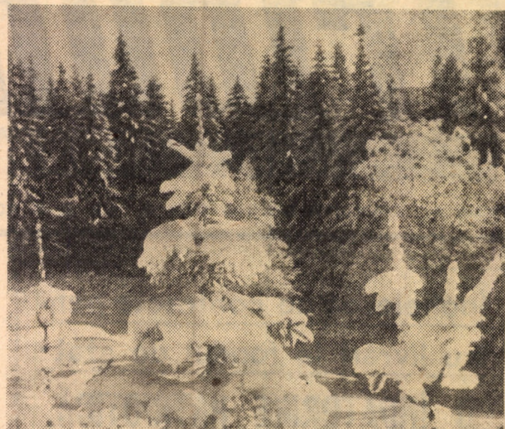
Invitație în munți