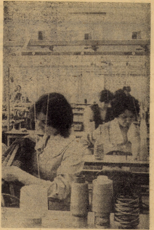
În cadrul atelierului tricatat al cooperativei „Textila” din incinta Complexului de servicii Sibiu (Piața Unirii), sînt confecționate o serie de produse mult apreciate de cumpărători

ORGAN AL COMITETULUI JUDEȚEAN SIBIU AL P.C.R. ȘI AL CONSILIULUI POPULAR JUDEȚEAN