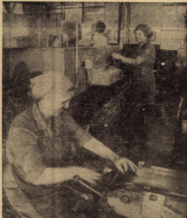
În noua hală de producție a sectorului creioane al I.P.L. Sibiu se află în funcțiune o linie modernă de fabricat mine pentru creioane care asigură o productivitate, într-un schimb, de cca 280 000 mine drepte, gata uscate și dimensionate, fapt care ușurează cu mult munca la faza de încheiere, la linia de prelucrare