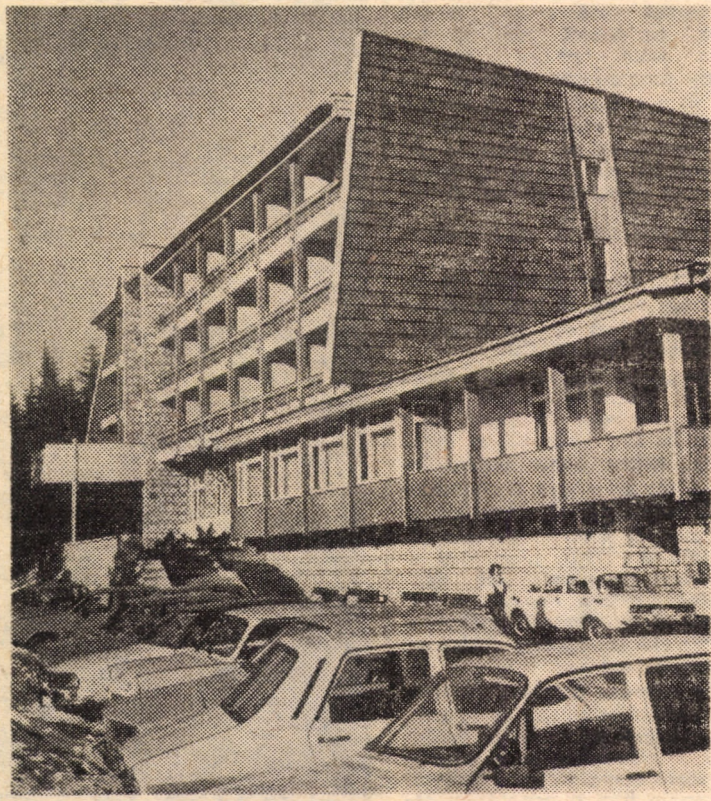
Impunătoare construcție a hotelului „Cindrelul” — o atracție pentru mulți dintre vizitatorii stațiunii climaterice Paltiniș