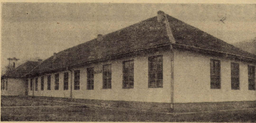
Noua școală din comuna Valea Viilor, ridicată cu puțin timp în urmă