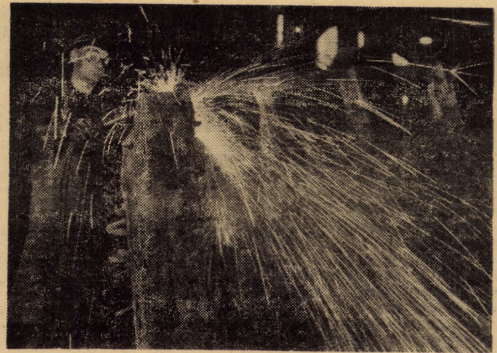
Aspect din secția curățătorie (sabla) a întreprinderii „Independența” Sibiu

re gospodărie în parte, urmînd folosirea eficientă a întregii suprafețe de teren existentă, inclusiv a loturilor personale, a curților și grădiniilor cooperativelor, sporirea efectivelor de animale și de păsări”. „Apropo de gospodăriile populației, în ce stadiu se află acțiunea de încheiere a contractelor?” „La speciile bovine adulte, tineret bovin și lînă am realizat deja peste 50 la sută din plan. Va trebui să impulsăm acțiunea de contractare la speciile porcine, oi, miei, lapte de vacă și lapte de oaie”. „Pe lîngă stimulentele stipulate în recentele acte normative, ce alte stimulente... locale folosiți?” „Pentru noi, asigurarea bazei furajere a constituit un adevărat nod gordian. O știe oricine: degeaba ai animale dacă n-ai cu