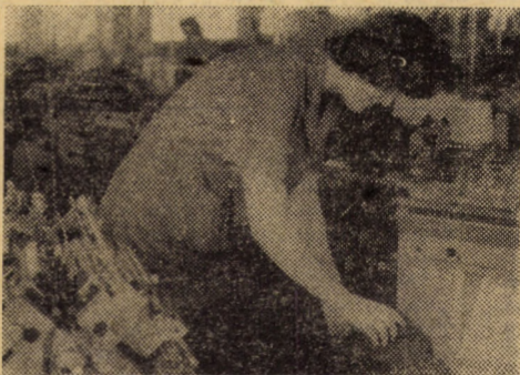
Întreprinderea de mînuși și ciorapi Agnita: Cu mașini moderne de mare productivitate se obțin sporuri însemnate de producție

Îndeplinirea în mod ritmic, cantitativ și mai ales calitativ a producției fizice planificate reprezintă, trebuie să reprezentăm preocuparea principală a fiecărei unități economice, pornind de la necesitatea — subliniată nu o dată de conducerea partidului — realizării unei concordanțe între cererea de consum intern, productiv și neproductiv și solicitările pieței internaționale la fiecare produs și grupă de produse în parte.