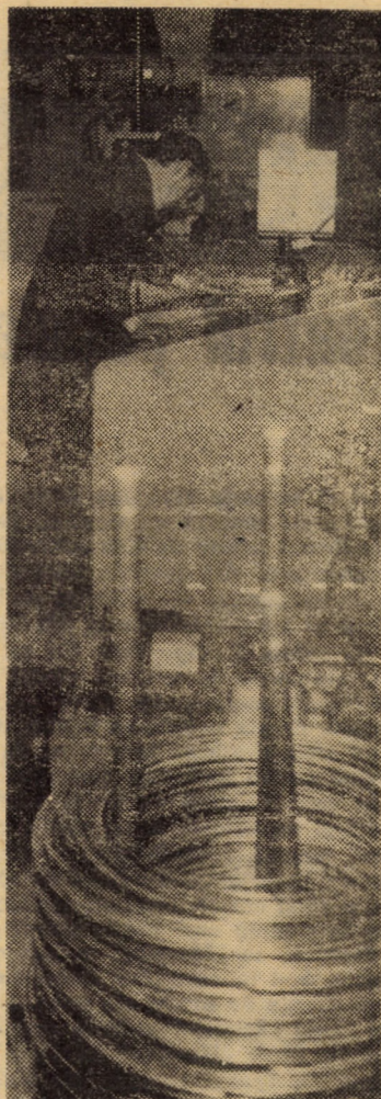
Întreprinderea mecanică Mediaș. În imagine: agregat modern pentru obținerea niturilor prin extrudare la rece, necesare dispozitivului de ambreiaj de la automobilul „Dacia”