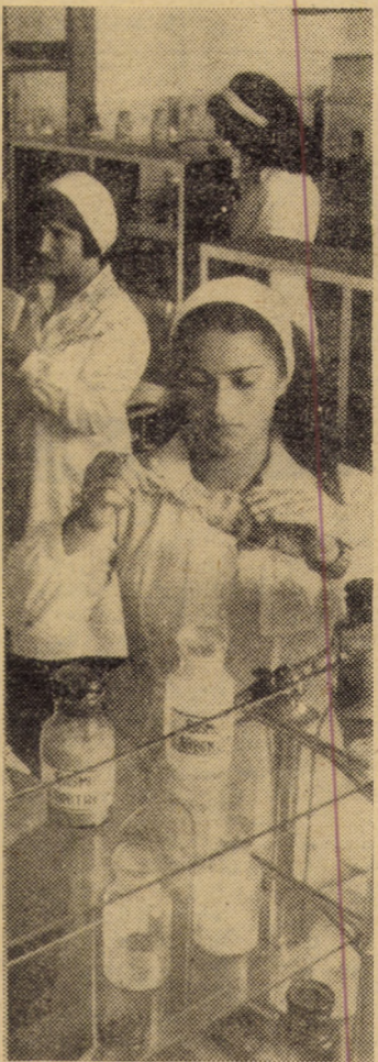
Instruirea practică a elevilor Liceului sanitar Sibiu în laboratorul de farmacie cu 12 ghișee

La sfecla de zahăr, în adunarea generală, cooperatorii au hotărît ca, în acest an, producțiile să se ridice la minimum 30 mii kilograme la