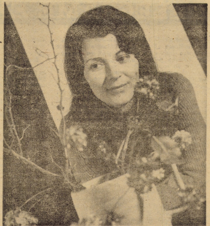
„Atit de fragedă, te-asemeni...”

2) Toate terenurile ce urmează a fi însămînțate, în această primăvară, au fost arate din toamnă. În primăvara aceasta se vor mai face arături numai pe terenurile reprimate de la A.E.I. Șeica Mare. Pe solele ce urmează a fi însămînțate cu sfeclă de zahăr, sfeclă și gulii furajere, plante tehnice etc. s-au