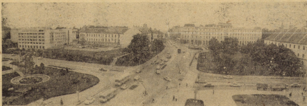
Piața Unirii din Sibiu, cu una dintre cele mai aglomerate intersecții, văzută de la... înălțime