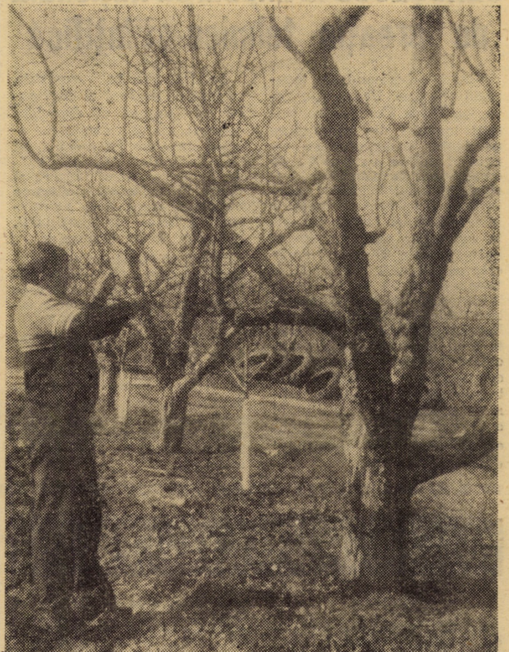
La Ferma nr. 9 pomicolă a I.A.S. Mediaș se execută tăierile de formare a coroanei și fructificare

P.S. A dat colțul ierbii, au început să vegeteze culturile. Se pare că unii au uitat de Decretul Consiliului de Stat al R.S.R. care stabilește sancțiuni aspre pentru cei care sustrag produse agricole sau distrug culturile. În raidul făcut în ziua de 18 martie pe unele din culturile semăntate în toamnă de I.A.S. Axente Sever pășteau oi și miei. Prin alte terenuri cultivate s-au făcut căi de acces spre pădure. Organele locale ale puterii de stat sint obligate ca, în toate cazurile, să ia măsuri ferme pentru protejarea fondului funciar, a culturilor agricole.