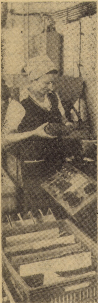
Întreprinderea „Flamura roșie” Sibiu. Cu ajutorul unor utilaje de mare productivitate, la compartimentul articole de scris, zilnic sînt umplute cu pastă cca 250 000 mine de diferite culori

În viitorul apropiat, proiectanții colectivului amintit vor realiza alte dispozitive și mașini destinate dotării întreprinderii medieșene. Între acestea, prioritatea o dețin o presă hidraulică pentru articole tehnice — respectiv, amortizoarele folosite în industria textilă — și un dispozitiv pentru presat perne Kalcera, aduse în momentul de față de la întreprinderea „Clujana”.