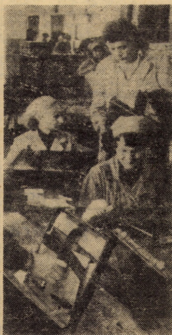
În atelierul truse diplomat, ca de altfel la toate locurile de muncă de la „13 Decembrie” Sibiu, exigența pentru calitate a devenit un deziderat al fiecărui muncitor.

Judecînd după cantitățile de produse preluate, cititorul își va imagina probabil o microfermă organizată după cele mai riguroase canoane ale activității zootehnice. Intrînd însă pe poarta din strada Văii nr. 168, ne-am convins că de fapt este vorba despre o gospodărie individuală clasică — grajd, șură, adăpos-