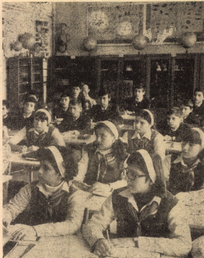
Desfășurarea orelor de geografie și biologie la Școala generală nr. 18, Sibiu, are loc în cadrul unui laborator dotat cu un bogat material didactic.