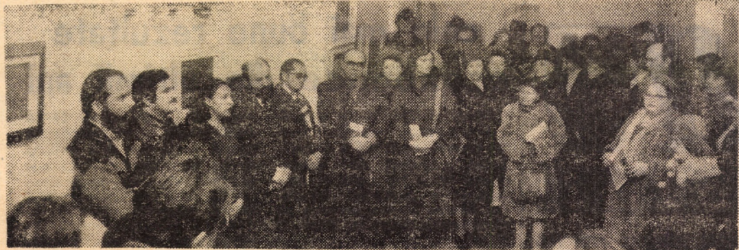
Vernisajul expoziției personale de pictură Nicolae Iorga