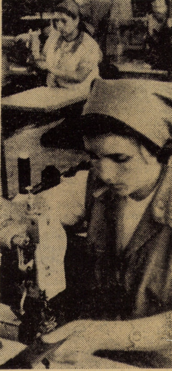
La banda de lucru în flux tehnologic de la întreprinderea „13 Decembrie” Sibiu lucrează tineri a căror vîrstă medie este de 25 ani