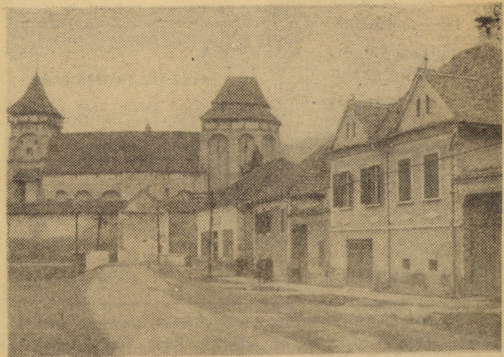
Din peisajul comunelor județului nostru: Valea Viilor

— Cum prestațiile mecanizatorilor sînt influențate de starea tehnică de mașinilor agricole se impune precizarea că cele 219 tractoare de care dispunem, celelalte utilaje au fost reparate, verificate și testate funcțional în condiții similare celor din teren. Pentru semăntul sfeclii de zahăr de pildă am pregătît 9 mașini cu 6 și 9 secții, funcție de dispunerea geografică a terenului (deal sau suprafață plană). Se lucrează numai în formații organizate la nivelul subunităților, fapt care ne-a permis declanșarea concomitentă a semăntului în toate unitățile consiliului. Utilajele au fost nominalizate pe mecanizatori, în acest fel creîndu-se atât posibilitatea specializării (implicație pozitivă asupra calității lucrărilor) cît și a mai bunei întrețineri a utilajelor. Carburanții și lubrifiantii sînt la nivelul necesarului, iar pentru depanările accidentale am organizat 2 echipe de intervenții.