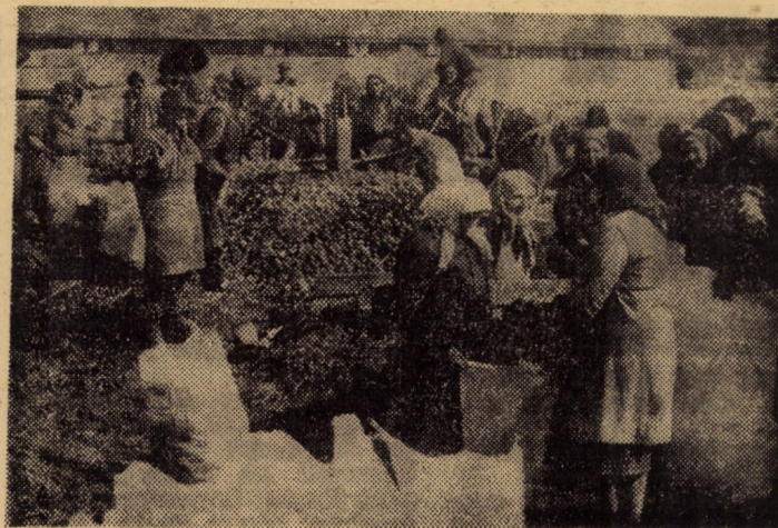
Un mare număr de membri cooperatori de la Porumbacu de Jos se aflau sîmbătă la sortatul cartofilor.

„Se impune folosirea în și mai mare măsură a bazei ma-