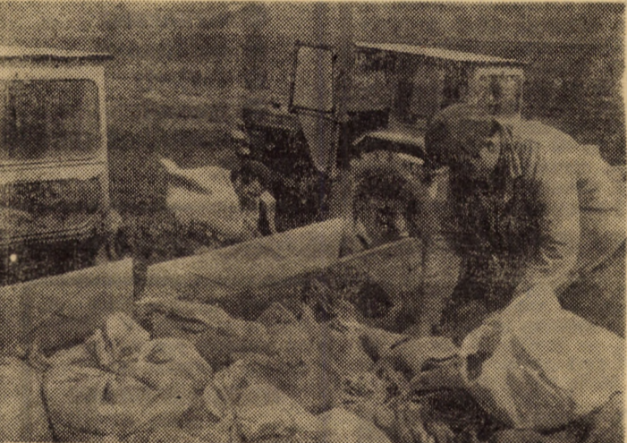
Scurt popas pentru umplerea buncărelor cu sămînță