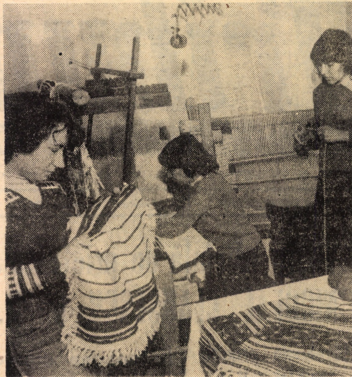
Frumoasele articole de artizanat — ștegere, fețe de masă, carpete, scoarțe oltenesti, etc. — lucrate de elevii Școlii populare de artă din Sibiu — sînt unanim apreciate cu ocazia unor manifestări expoziționale sau festivaluri culturale-artistice