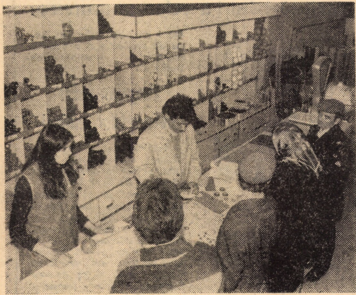
Recent, in cadrul magazinului „Ferometal” din Sibiu a fost amenajat raionul cu articole sanitare, articole care au fost desfăcute pînă nu demult la fostul magazin „Sanitas” din cartierul Hipodrom III