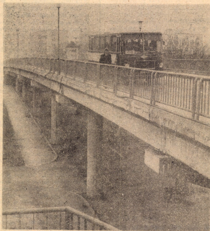
Viaductul de la Gara Mică, a rezolvat fluiditatea traficului rutier la una din „porțile” Sibului zilelor noastre.

Formațiile artistice laureate în ediția precedentă a Festivalului național „Cîntarea României” ale Casei orașenești de cultură din Agnita prezintă astăzi, ora 19, pe scena Casei de cultură a sindicatelor din Sibiu un spectacol muzical coregrafic.