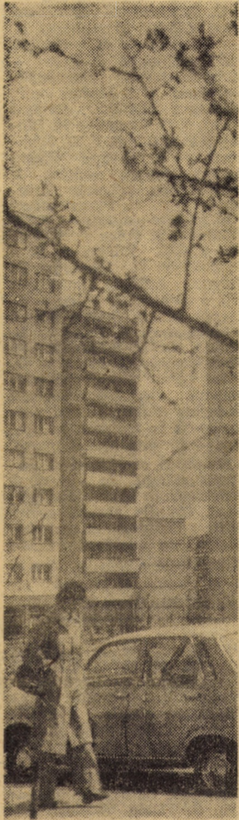
Explozia mușurilor — semnul mult așteptat al primăverii

S-a omologat preliminar, pe standul întreprinderii „Independența”, primul cuptor electric izolat cu fibră ceramică proiectat de specialiștii filialei Sibiu a I.C.S.I.T.P.S.C. și realizat pentru prima dată în țară de întreprinderea „Independența”. Totodată, s-a experimentat și aplicat la acest cuptor regulatorul de temperatură tip I.A.E.M. — Timișoara. Prin aplicarea celor două soluții s-a obținut un reglaj de temperatură linear, cu un domeniu de dispersie a temperaturilor de maximum 6°C în spațiul de lucru. Este cea mai ridicată performanță realizată pe asemenea cuptoare proiectate și realizate în țară. Totodată, s-au confirmat în practică performanțele antecalulate în faza de proiectare, respectiv în ceea ce privește reducerea substanțială a consumurilor energetice și de metal, al inerției la pornire etc.