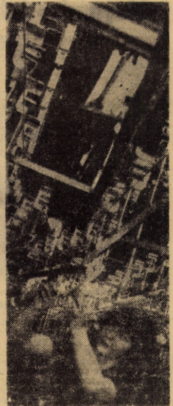
Utilajele moderne din secțiunile de producție de la Întreprinderea „7 Noiembrie” Sibiu sînt deservite în bună parte de tineri cu o bună pregătire profesională.

Între 100—101 la sută: „Independența” Sibiu, „Metalurgica” Sibiu, „Mecanică” Sibiu, „Carbosin” Copșa Mică, I.P.E.T. Sibiu, „Record” Sibiu, „Tîrnava” Medias, „11 Iunie” Cîsnădie, „Flaro” Sibiu, Întreprinderea de cuțite Ocna Sibiului, „Geamuri” Medias, „Sticla” Avrig, „7 Noiembrie” Sibiu, „8 Mai” Medias, I.M.A.I.A. Sibiu.