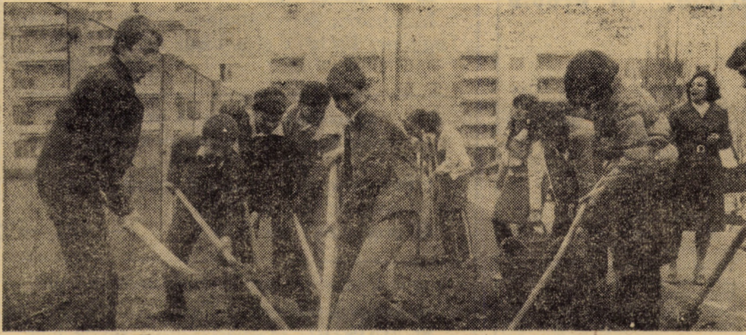
Elevii Școlii generale nr. 19 Sibiu lucrând la menținerea și înfrumusețarea spațiilor limitrofe