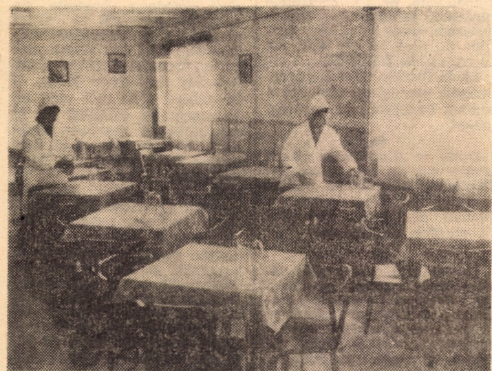
Recent la F.P.U.P.S. Sibiu a fost dată în funcțiune o cochetă micro-cantină cu 80 de locuri unde oamenii muncii din această unitate pot servi 3 mese calde pe zi. Toate lucrările de amenajare și dotare au fost realizate cu forțe proprii.