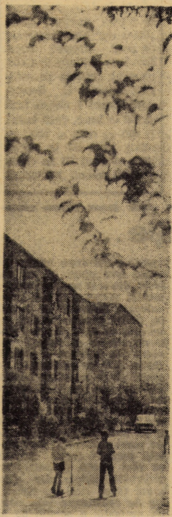
Prin cartierul „Zona parc” al orașului Agnita.